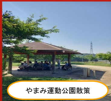
やまみ運動公園散策